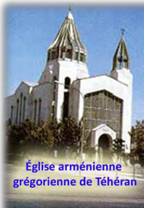
Église arménienne grégorienne de Téhéran

Mon séjour en Iran, pays du Moyen-Orient, a été l'occasion d'un contact privilégié avec des religions antiques qui ont marqué l'histoire du monde et avec plusieurs rites orientaux chrétiens. Leur rencontre dans ma vie quotidienne m'a permis d'«élargir l'espace de ma tente». Quelle joie de vivre une communion au-delà de la différence !