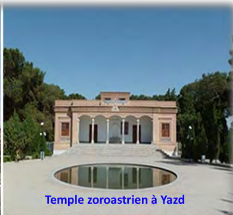
Temple zoroastrien à Yazd