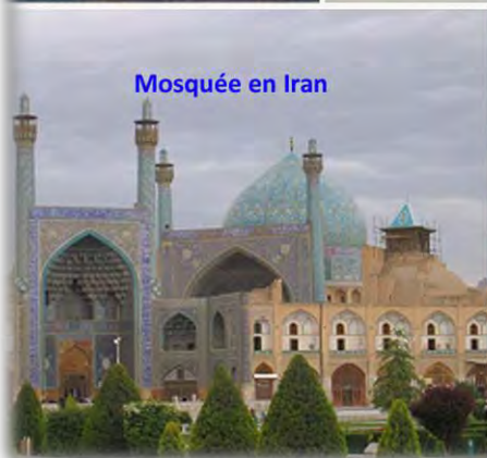
Mosquée en Iran