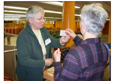
C'est bien moi !